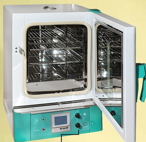
Trójstopniowa nastawa wentylatora